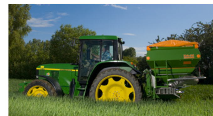
Pflanzen freuen sich über das staubarme Produkt.

Sie wollen doch keinen Staub aufwirbeln.