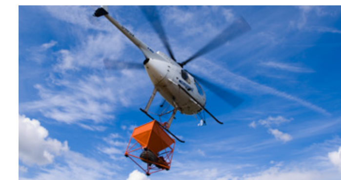
Große Arbeitsbreiten und Lufteinsätze sind kein Problem.